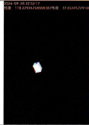
附图 1 现场照片